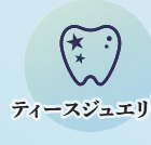
ティースジュエリー

「ようやく行きやすい歯医者を見つけた」と感じていただけるよう 患者様の不安を少しでも減らした歯科医院を目指して